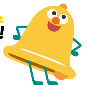
シラベル